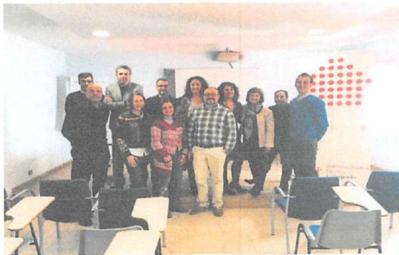
Miembros de la Junta de Gobierno